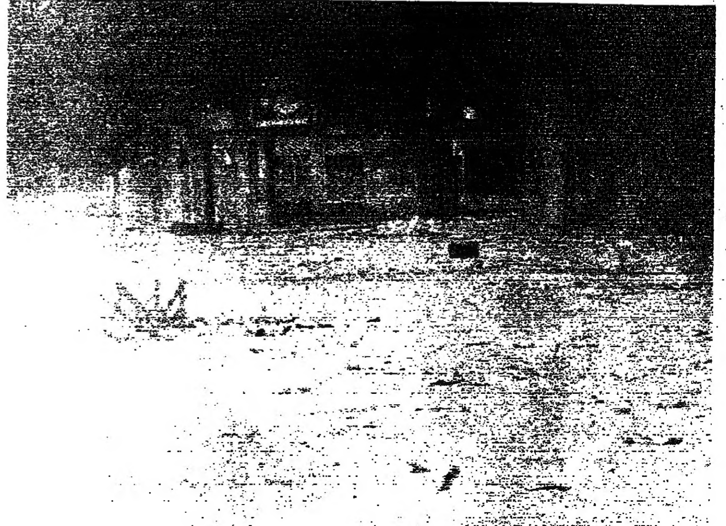
■ الزكام وسط شارع في منطقة الفنادق